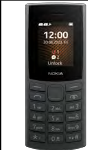
Nokia 105 4G DUAL SIM 0 EUR

Pentru telefoanele premium (ex. Samsung S sau Note, phone) este necesara precomanda la Orange, ulterior se primeste confirmarea de rezervare si termenul estimat de livrare