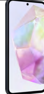
Samsung A35 5G 128GB 0 EUR