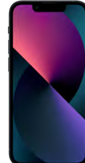
iPhone 13 128 GB 0 EUR