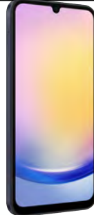
Samsung A25 5G 128 GB 0 EUR