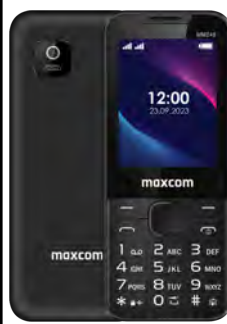
Maxcom MM 248 4G 0 EUR