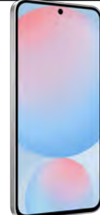
Samsung S24 FE 5G 128GB 0.84 EUR