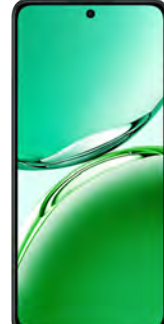
Oppo Reno 12FS 5G 512GB 0 EUR