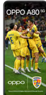
Oppo A80 5G 256GB 0 EUR