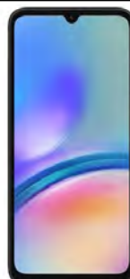
Samsung Galaxy A05 64GB 27.73 EUR