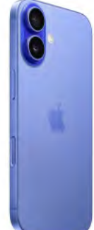
Apple iPhone 16 128GB 0 EUR