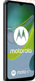
Motorola Moto E13 0 EUR