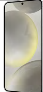
Samsung S24 5G 256GB 0 EUR